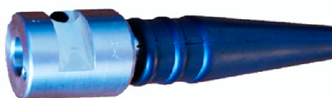
Герметичный кабельный CSP терминал для подключения датчиков AADI

Гарантия – 12 мес. после отгрузки изготовителем